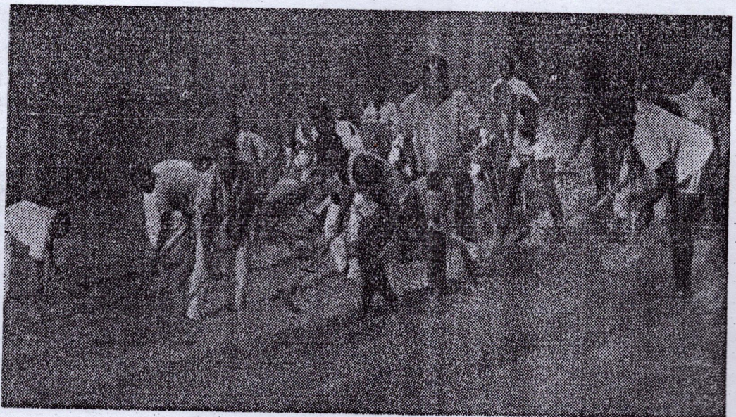
Mieux qu'un symbole, mieux qu'un trait d'union entre la travail intellectuel et le travail manuel, l'action productive de la jeunesse estudiantine vise le développement et la prospérité économiques du pays. La terre ne cesse jamais de répandre ses biens sur ceux qui la cultivent. - Telle est la conviction de ces jeunes conscients lancés avec enthousiasme dans le travail productif

Son implantation a été favorisée par la cession à la région de Pita des bâtiments naguère occupés par les travailleurs de Kinkon : environ 15 maisons préfabriquées. Celle-ci servent actuellement de bureaux, de classes, de logements de professeurs, etc... Signalons également